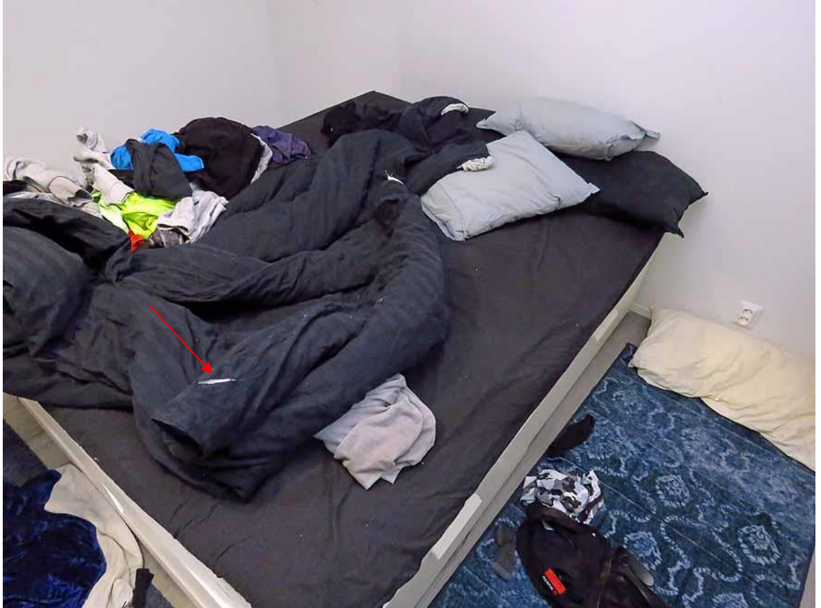
Nuolella osoitettu reikä esitetty tarkemmin tämän liitteen kuvassa 6