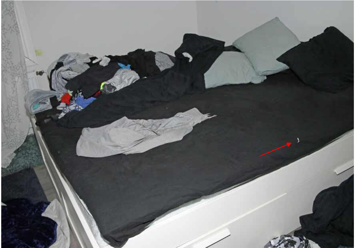
Nuolella osoitettu reikä esitetty tarkemmin tämän liitteen kuvassa 5