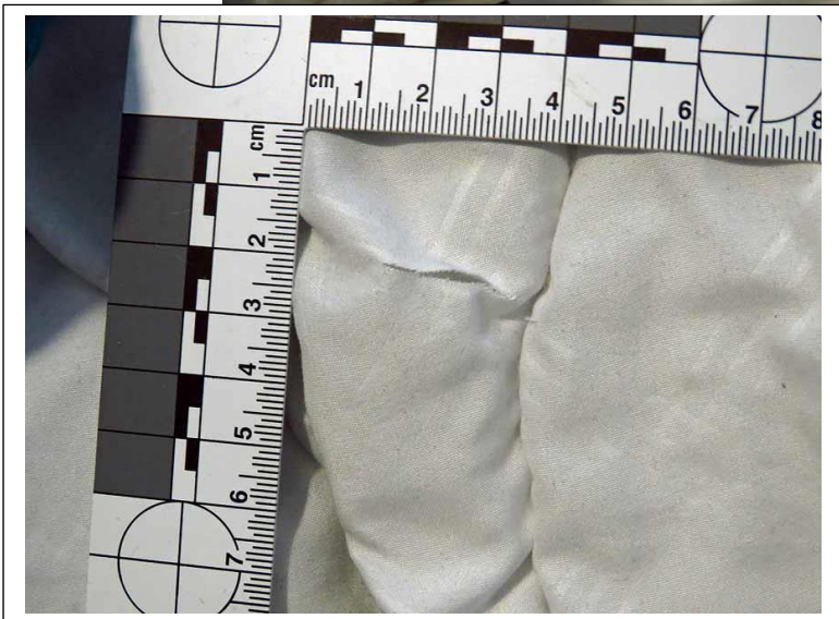
Peitossa oleva reikä esitetty tarkemmin tämän liitteen kuvassa 7