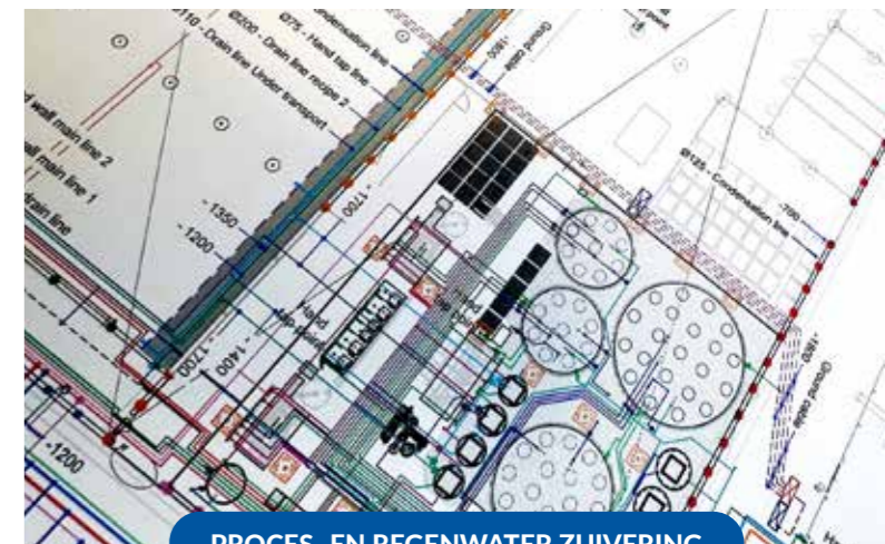
PROCES- EN REGENWATER ZUIVERING

Neem vandaag nog vrijblijvend contact met ons op! Hoe? Check onze website of scan de QR code. (Achterzijde folder) 'SCAN ME'.