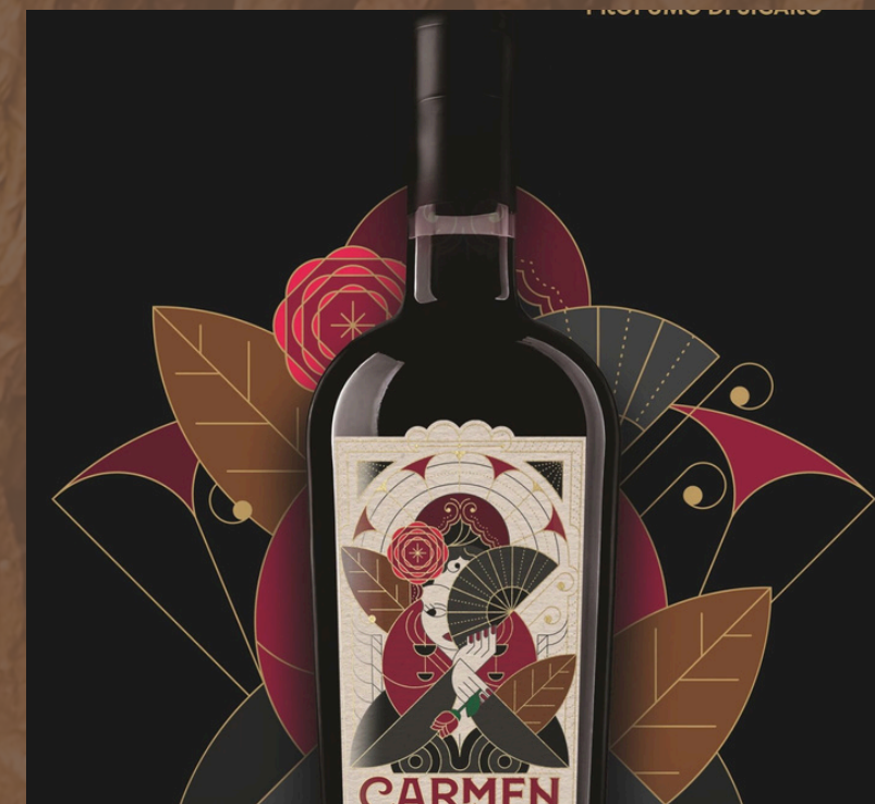
CARMEN- LA CREMA DI LIQUORE RIBELLE