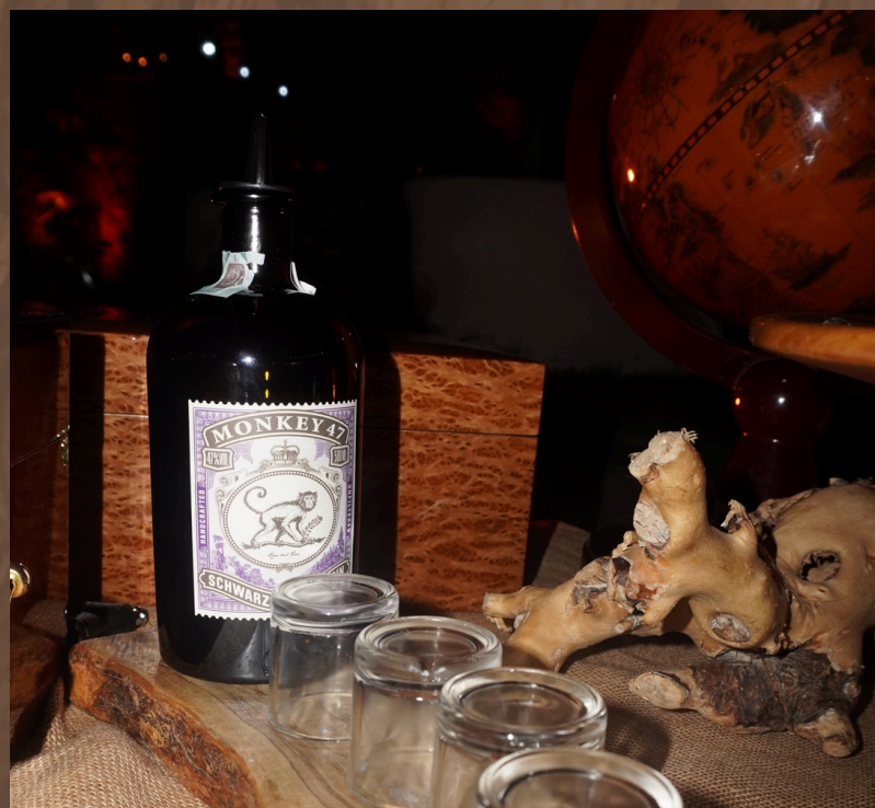
GIN MONKEY 47

Come ogni anno, Tabacco Eventi propone un'evoluzione del Tavolo Cubano per arricchire l'esperienza sensoriale e regalare agli sposi un servizio realmente esclusivo e unico in Italia nello scenario dei corner d'intrattenimento e in particolare dei cubani. L' upgrade del Tavolo , solo su richiesta, prevede un leggero adeguamento economico del servizio e consisterà nell'aggiunta di 1 distillato e 2 creme di liquori artigianali che seguiranno abbinamenti al cioccolato appositamente studiati.