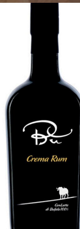
BÙ - CREMA AL RUM CON LATTE DI BUFALA 100%