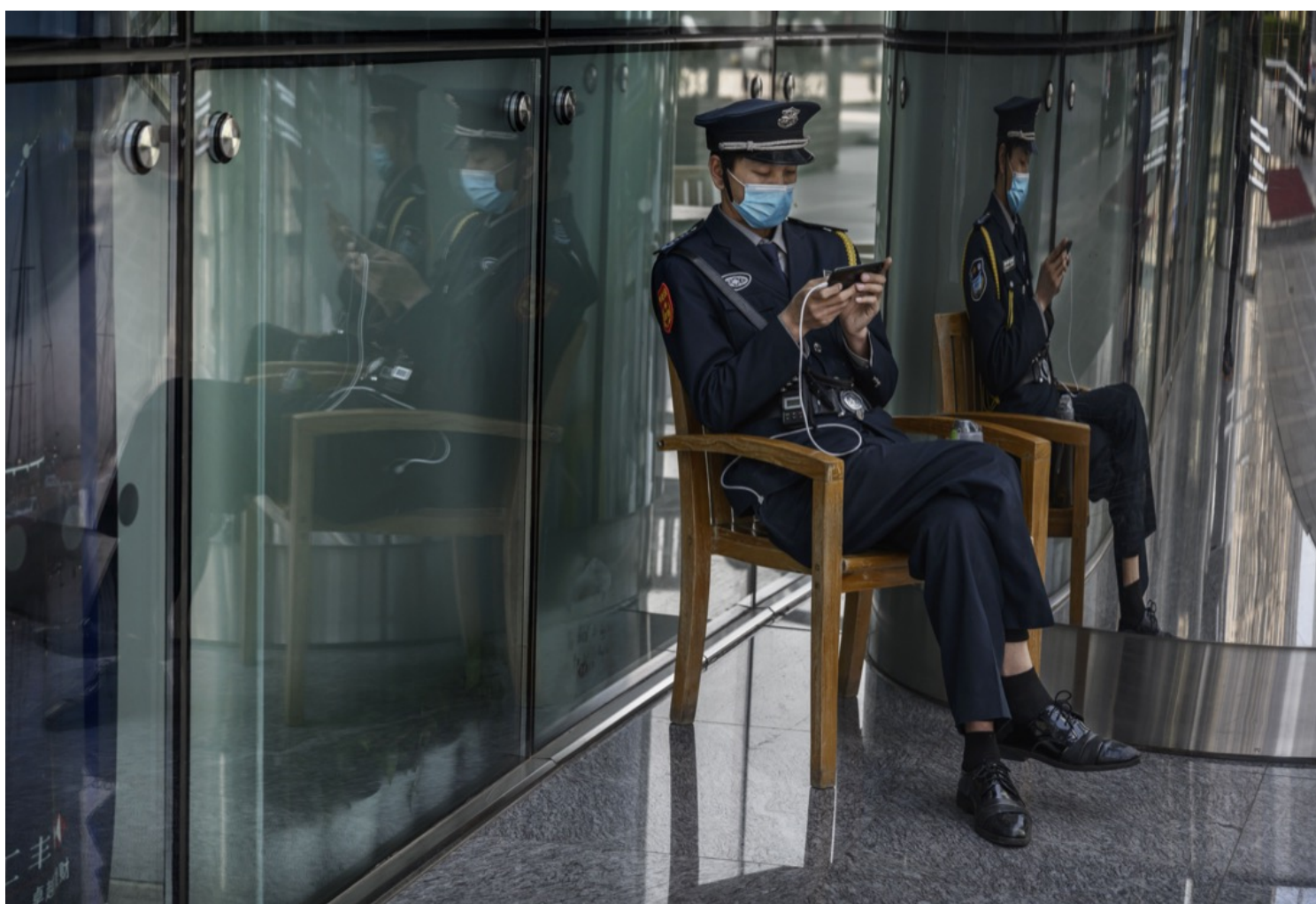
中国，一名保安员在办公大楼外看手机。

蒋敏说：“这些（监管）问题最终还是涉及到网络安全的问题。中国的监管思路主要是基于对国家安全的思考。它也保护个人数据的安全，但不会以牺牲国家的安全为前提。”