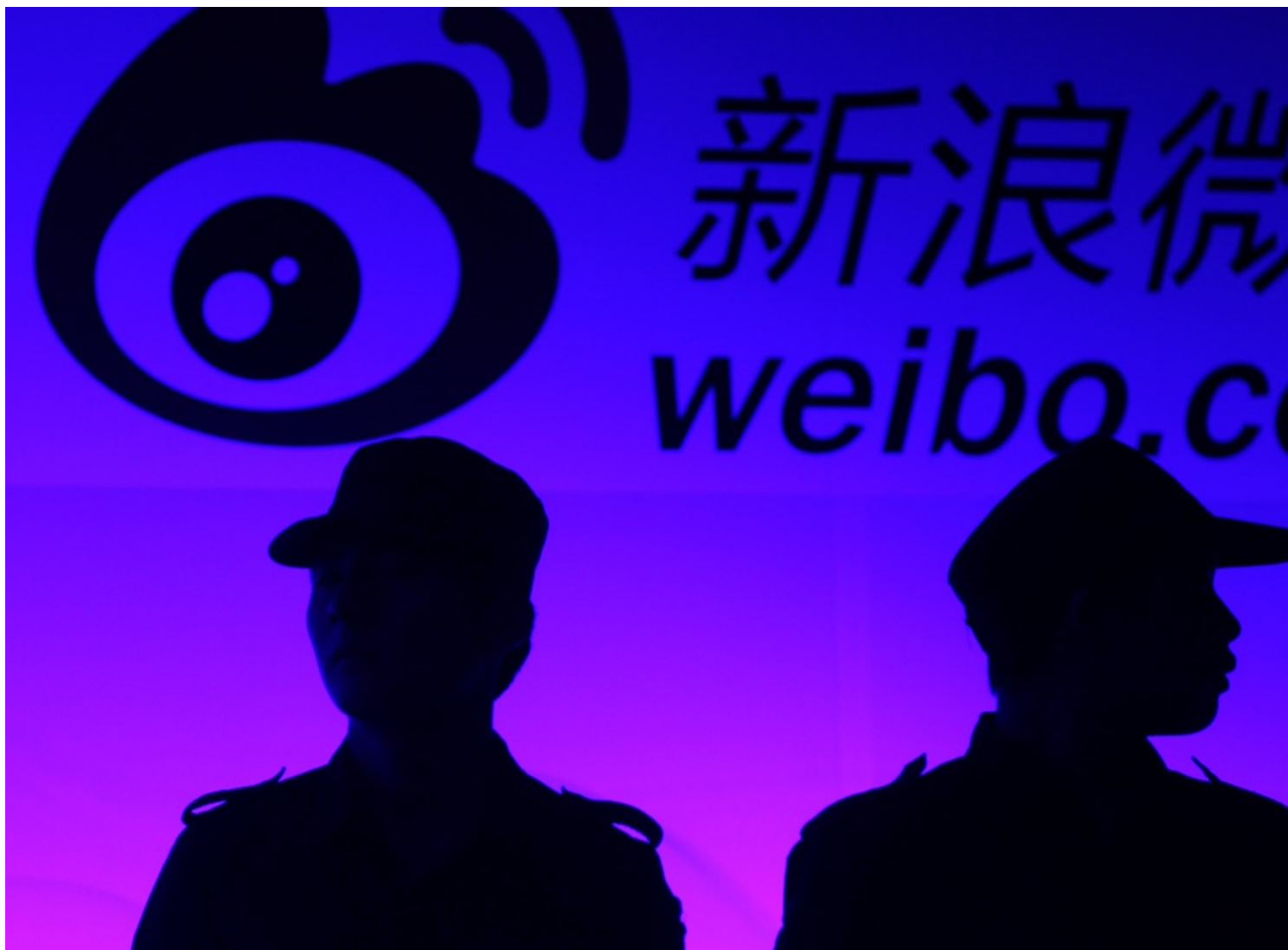
中国首都北京，中国国家互联网信息办公室举办的“世界互联网大会”，两名保安在参展商新浪微博的广告版前站岗。

“以前不是没有管理，但管理的方式有区别。比方说以前对百度付费搜索排序的做法通过媒体进行曝光，采用是法律以外的管理手段和方式。”蒋敏说。