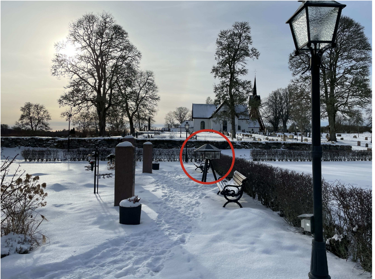
1. Ringen markerar bänken som de misstänkta berättat att de suttit på efter minnesgudstjänsten.