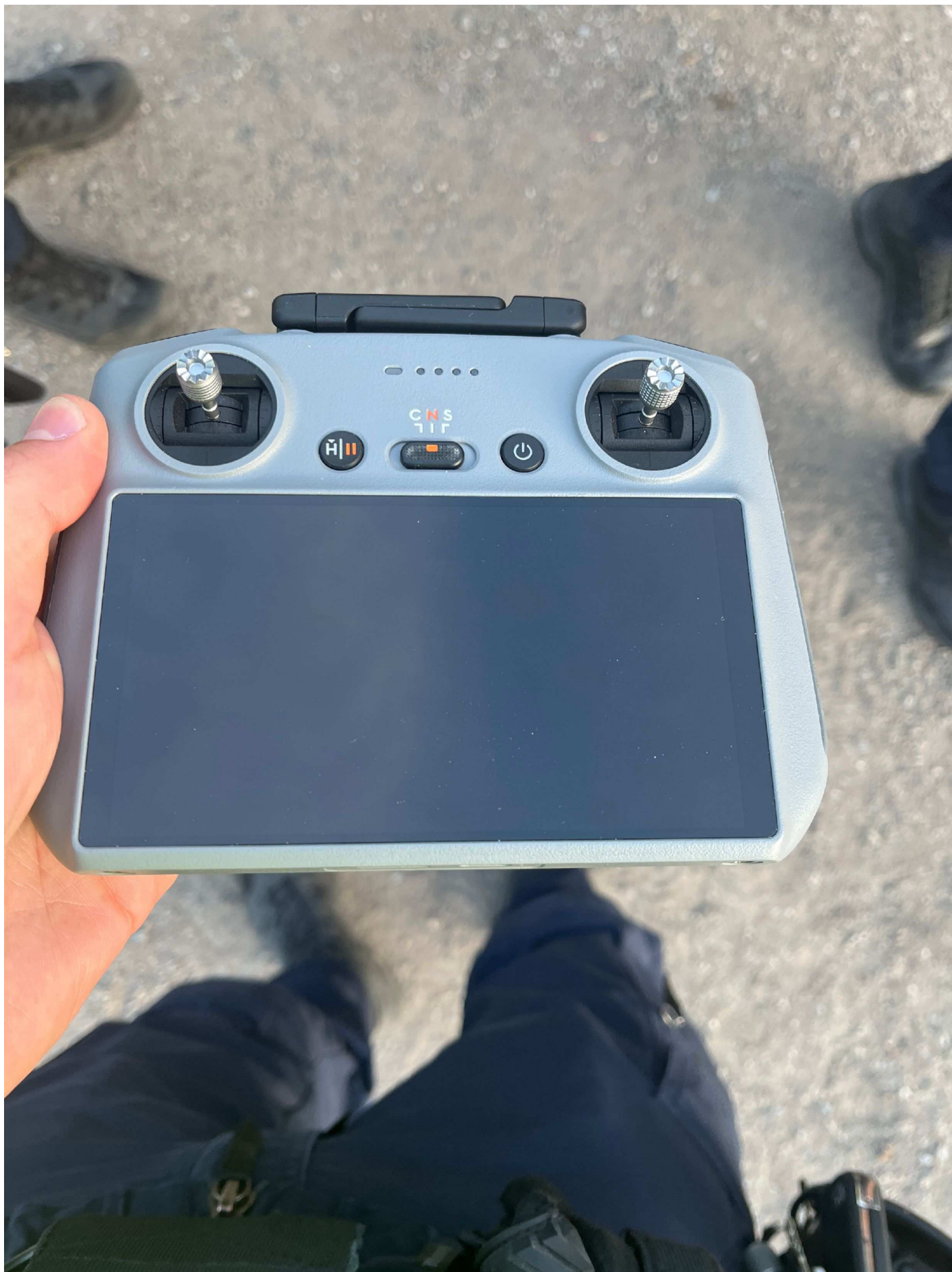
2. Framsida drönare