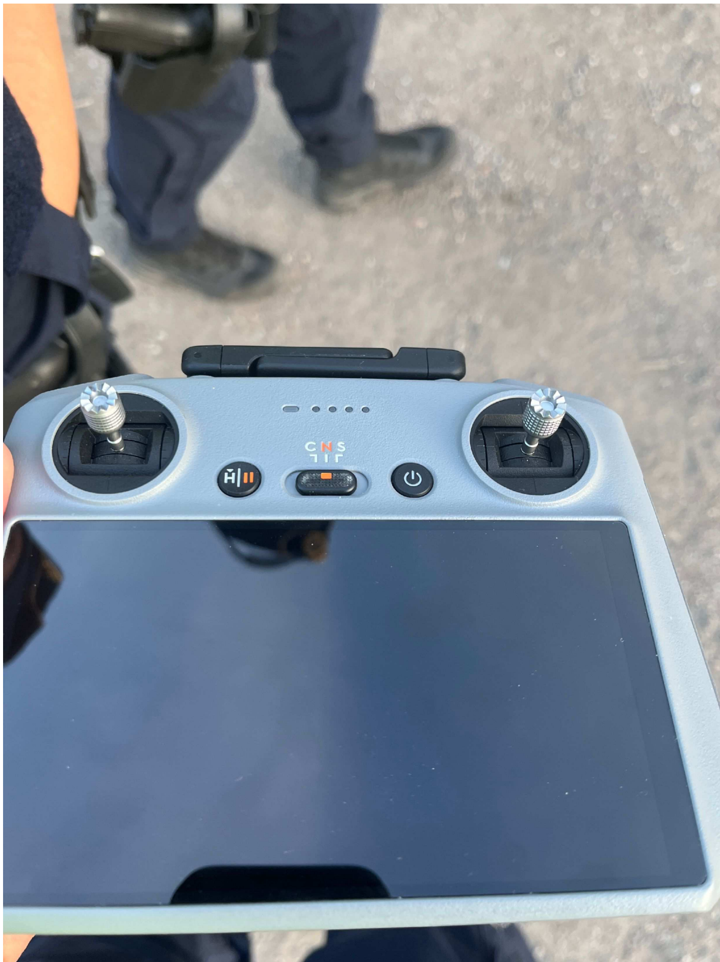
1. Framsida drönare