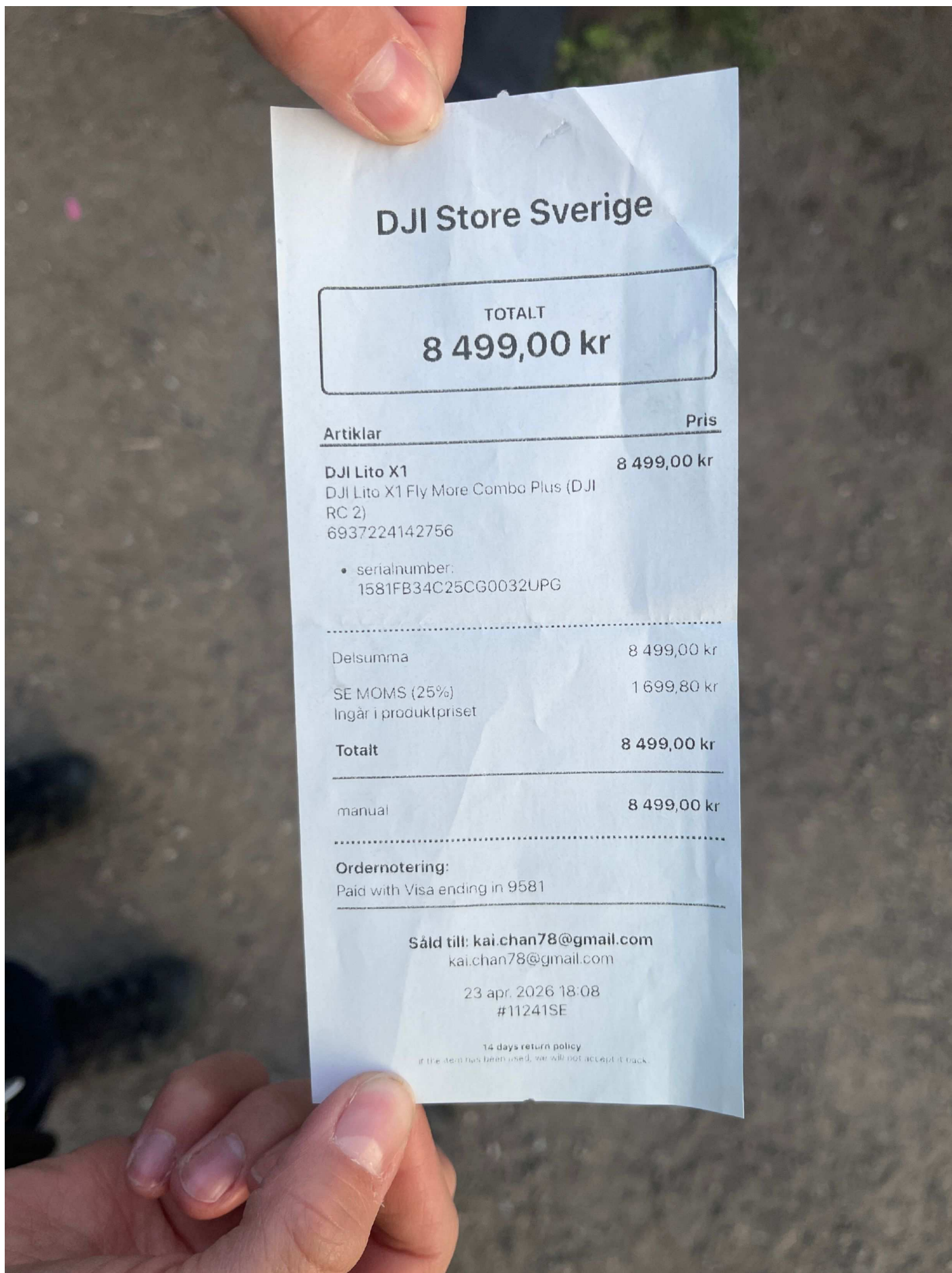
3. Kvitto till drönaren